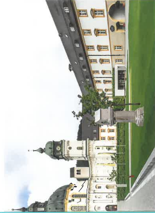
▲ KLOSTER ETTAL Ansicht von Kloster Ettal mit barocker Basilika.

Bildreihenachweis: S. 2: Detail Diorama und Briefmarken © Haus der Bayerischen Geschichte (HdBG), Fotos: Philipp Mansmann | S. 3: Ansicht des Tegernsees © bpk, Bayerische Staatsgemaldesammlungen; Badewanne © Bayerisches Nationalmuseum München, Foto: Bastian Krack | S. 4: Holzbibliothek © HdBG; Ochsenkopfglas © Kunstsammlungen der Veste Coburg | S. 5: Der Einsame © HdBG; Sturzbecher © Bayerisches Nationalmuseum München | S. 6: Anfahrtskizze © GROW communications | S. 7: Versatzstücke © HdBG; Bayerischer Trachtenverband; Bezirk Oberbayern; Archiv Freilichtmuseum Glentleiten; Schuhplattler © HdBG | S. 8: Kloster Ettal © Olaf Herzog | S. 9: Ettaler Madonna © Benediktinerabtei Ettal, Foto: Angela und Luz Stoesch | Gestaltung: Peter Schmidt Group, München. * Alle Angaben ohne Gewähr.