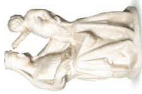
▲ ETTALER MADONNA Nachbildung der Ettaler Madonnen aus Marmor.