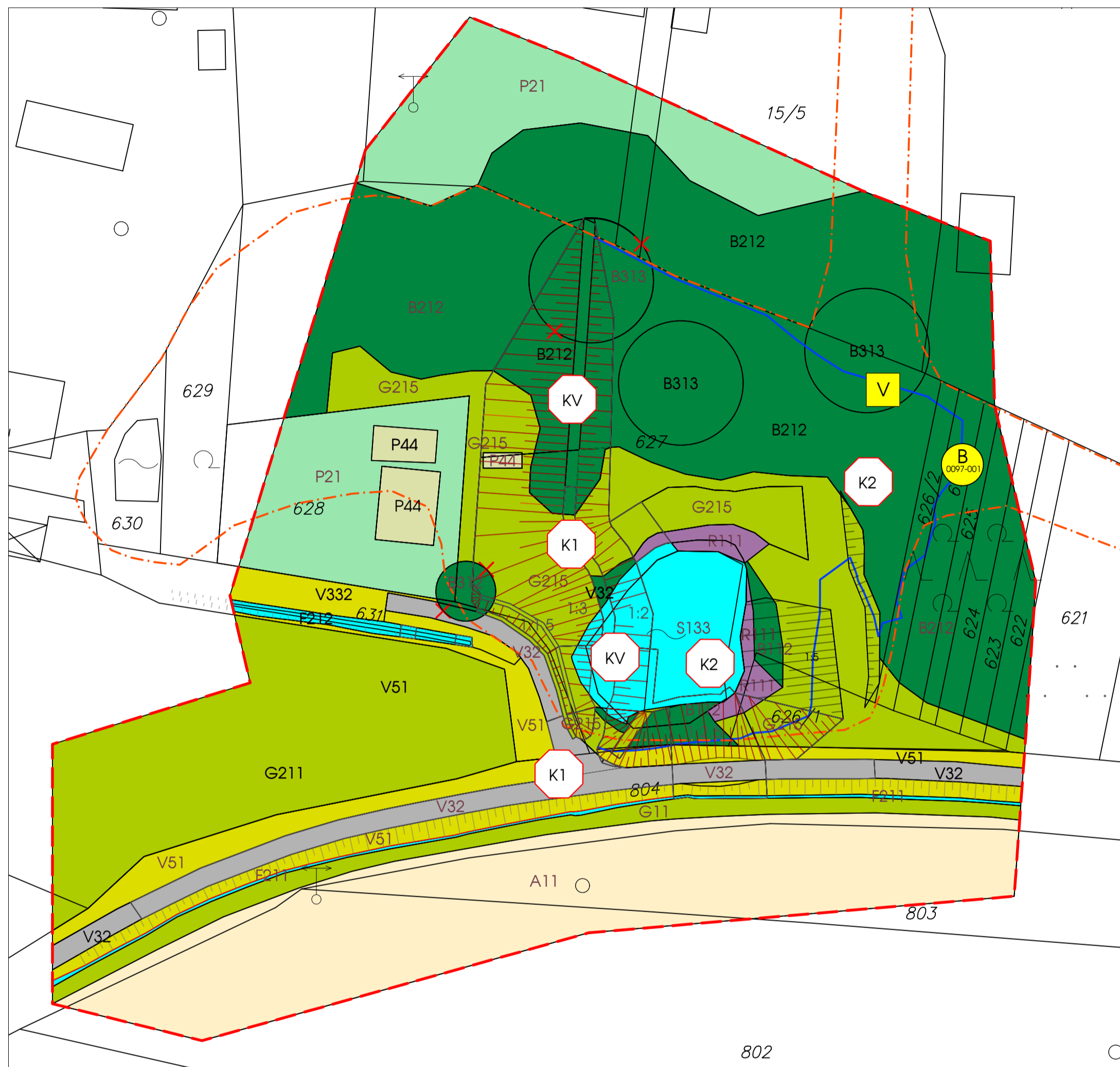
Bestands- und Konfliktplan M 1 : 500