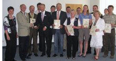
Zertifizierung der ÖKOPROFIT-Betriebe

Alle acht Betriebe, die sich im Jahr 2009/2010 am betrieblichen Umweltschutzprogramm ÖKOPROFIT Landkreis Kelheim beteiligt haben, sind nun erfolgreich zertifiziert. Gemeinsam sparen sie jährlich mehr als 150.000 € Betriebskosten ein und leisten mit knapp 1.000 t CO 2 -Reduzierung einen erheblichen Beitrag zum Klimaschutz. Allein im Sektor Stromersparung wird das Jahresäquivalent von 135 4-Personen-Haushalten eingespart (593.000 kWh).