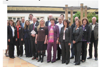
Partner des Gesundheits-Netzwerks im Landkreis Kelheim

Beschlossen wurde ein halbjährliches Treffen von Gesundheitspartnern und interessierten Betrieben, um sich über ausgewählte Probleme der betrieblichen Gesundheitsförderung zu informieren und zu beraten. Die konkreten Angebote der Partner des Gesundheits-Forums finden Sie unter: